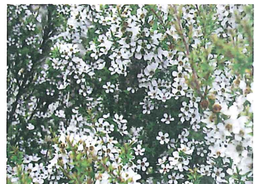
先住民マオリ族が「癒やし木」と呼ぶマヌカはニュージーランドのみに自生する低木。

マヌカハニーの美容効果の一つは、強力な抗菌作用です。これは、マヌカハニーにしかないMGO(メチルグリオキサール)という抗菌物質の働きによるもので、これにより吹き出物の原因となるアクネ菌などを強力に殺菌します。大人の吹き出物は、乾燥肌にもできますが、マヌカハニーは保湿効果もあるので、潤いも与えてくれます。MGOの強力な抗菌作用によりニュージーランドでは、傷や口内炎等の治療にも使われ、ピロリ菌にも効果があるとも言われています。二つめは、美肌に有効な抗酸化作用です。これは、シリング酸メチルという抗酸化物質によるもので、コラーゲンを破壊しシミやシワ、たるみ等の原因となる活性酸素を除去し、美肌をもたらします。